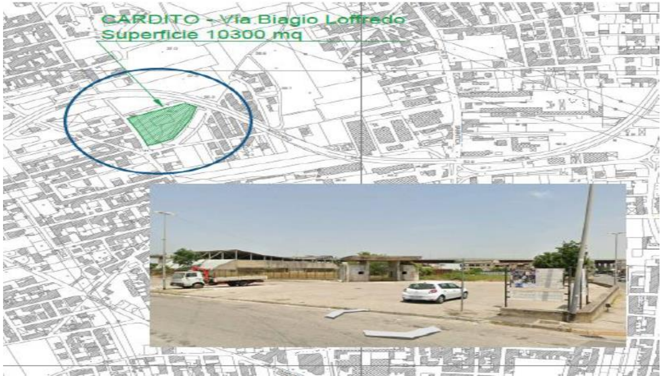
Figura 1. Collocazione territoriale area di intervento

Si riportano di seguito alcune foto aeree per l'individuazione dell'area oggetto dell'intervento.