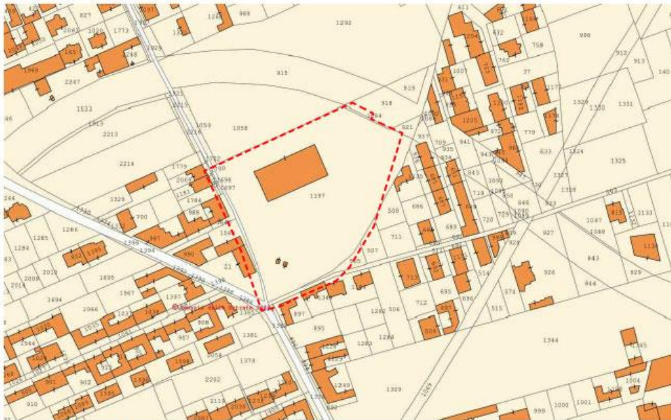
Stralcio mappa catastale - foglio 3 p.l.lla 1197